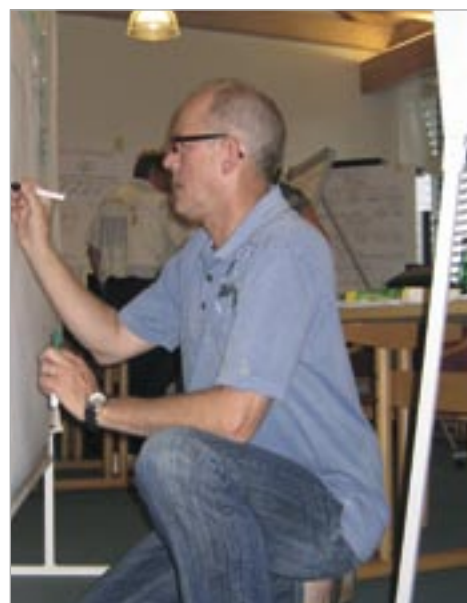
Präsentation und Moderation: Basis-Skills für fortgeschrittene Trainings-Teilnehmer