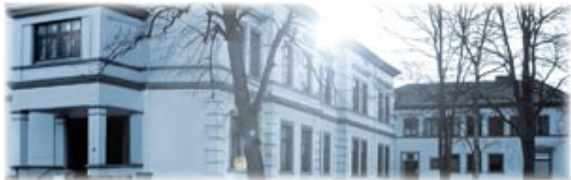
AFW-Leitbild: Symbol für Pioniergeist und Kontinuität

Im Vergleich zu anderen Bildungsansätzen für Trainer und Berater auf dem deutschen Bildungsmarkt kann die AFW Wirtschaftsakademie mit ihrer vorliegenden Ausbildung in der Kombination folgender zwölf Vorteile eine absolute Alleinstellung beanspruchen: