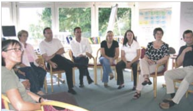
Ausbildung vernetzt: Klausur-Atmosphäre im Haus Hessenkopf

Fortgeschrittene und angehende Trainer und Berater hatten sich in der didaktischen Idealbesetzung von zwölf Teilnehmern – sechs Damen und sechs Herren – mit ihren Dozenten, Trainern und Moderatoren in Klausur begeben. An den 16 Tagen vom 26. Juli bis 10. August 2008 nahmen sie so gut wie rund um die Uhr in der Abgeschlossenheit der Tagungsstätte Haus Hessenkopf auf dem Steinberg bei Goslar an einem neuartigen Intensiv-Seminar teil, das sie zu Trainern und Beratern in Führungsfragen weiterbilden sollte.