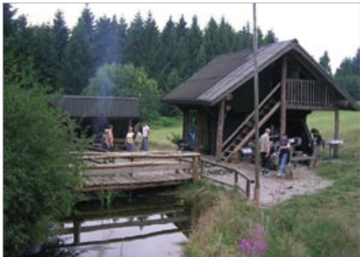
Team-Erlebnisse im Outdoor-Training: Forsthütte bei Clausthal-Zellerfeld