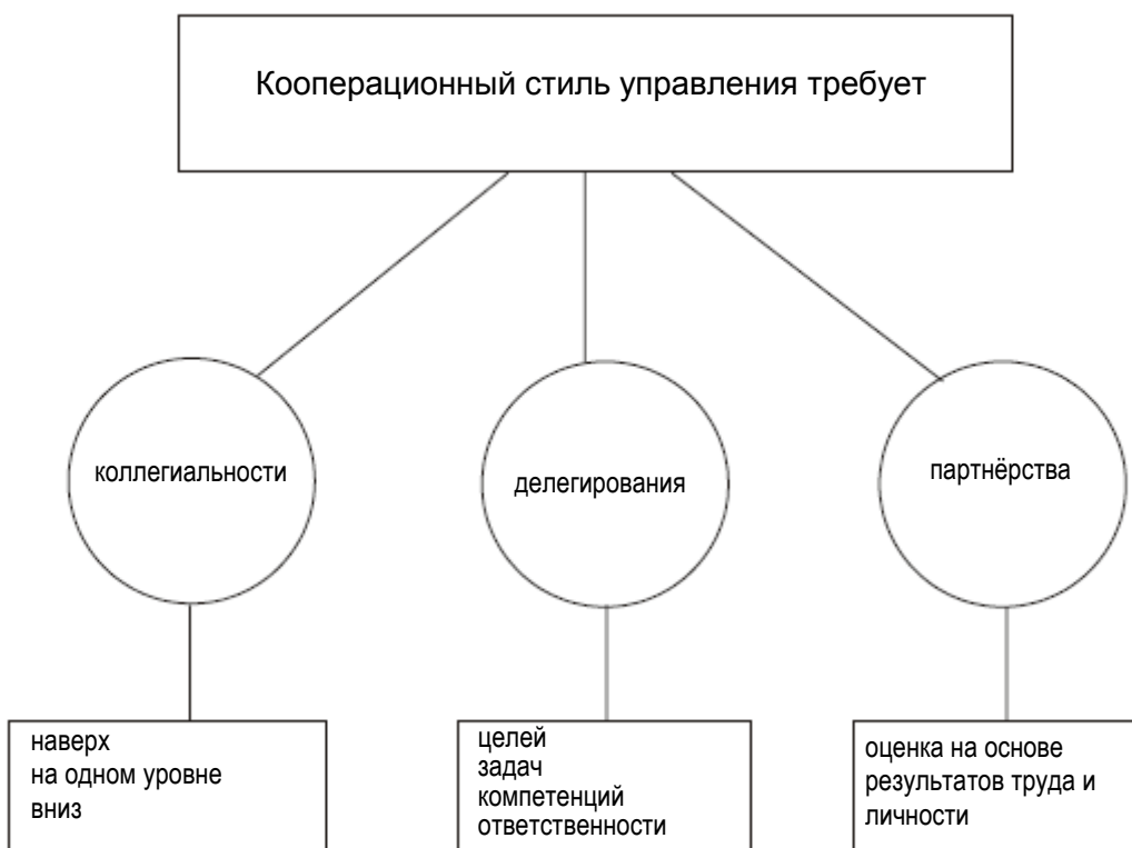
Иллюстрация 4: Основные элементы кооперационного управления

Поскольку обе рассмотренные формы управления: авторитарный и кооперационный стили руководства – в своей чистой форме представляют собой лишь предельные значения в разнообразии возможных стилей, далее на иллюстрации 5 рассмотрены смешанные формы двух стилей, где соответствующая часть одного стиля определяется на основании определённого поведения руководителя.