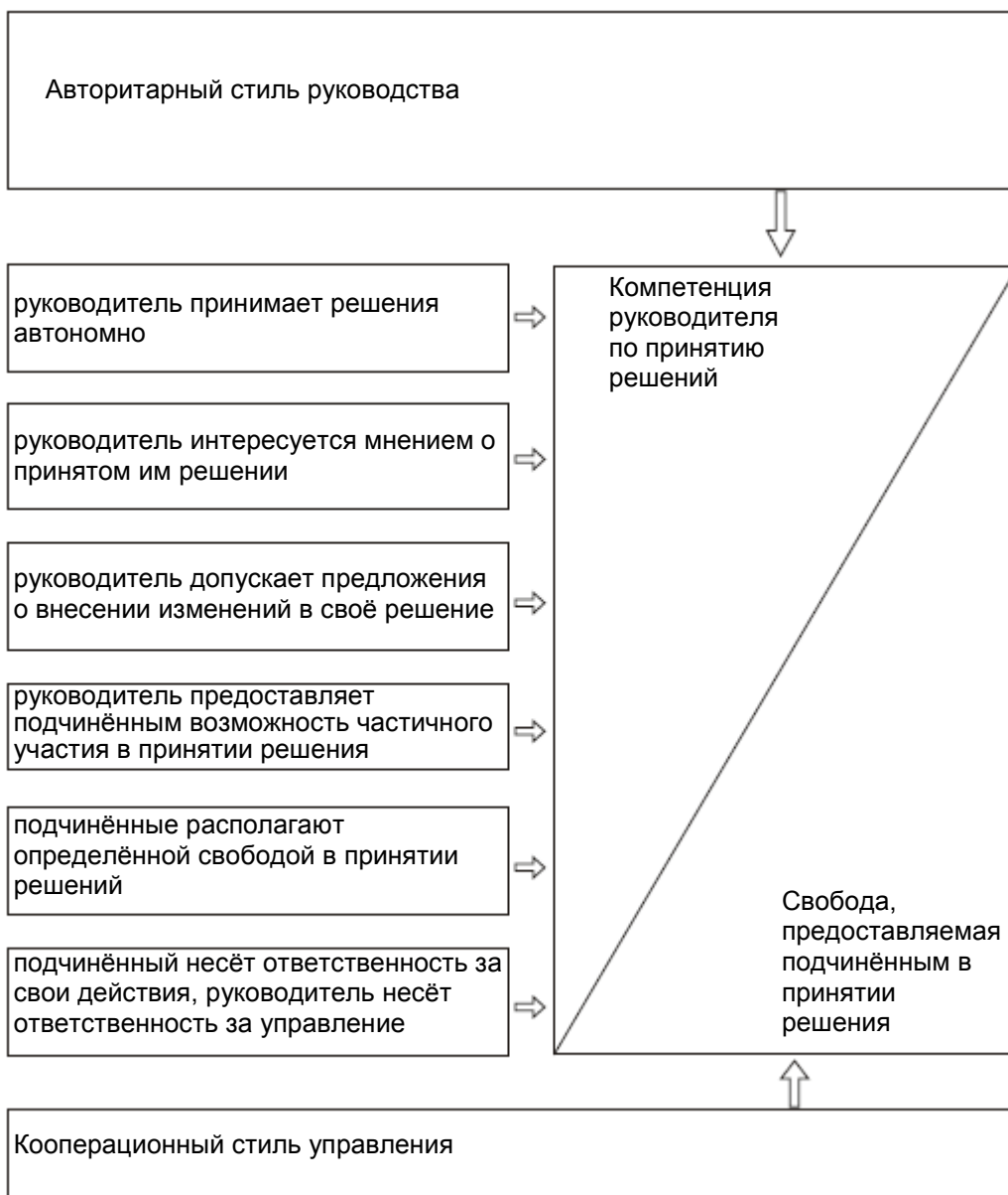
Иллюстрация 5: Выражение авторитарного и кооперационного стилей управления в зависимости от управленческого поведения