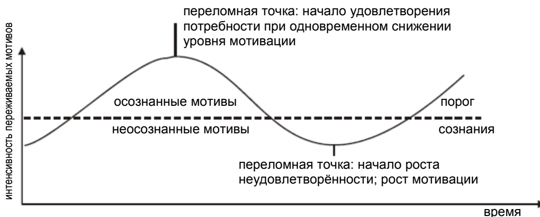
Иллюстрация 2: Изменение уровня мотивации при удовлетворении и неудовлетворении потребности. Человек может испытывать мотив осознанно и неосознанно. 2